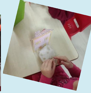
Orman Haftası panoları hazırlandı